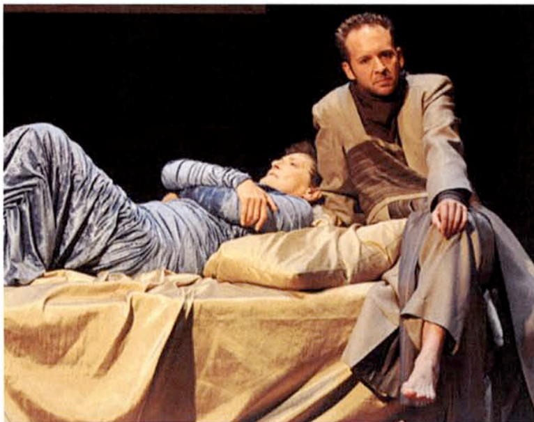
« Jocaste reine »