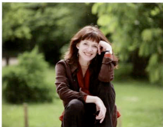
Nancy Huston