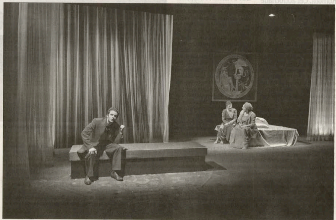
Jocaste reine avance en équilibre entre une Antiquité suggérée et des questions contemporaines. ISABELLE DACCORD

Ce qui frappe aussi très vite, c'est le caractère hautement