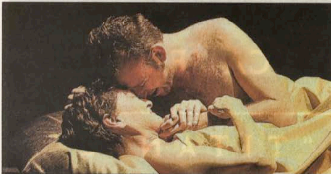
Dernières représentations, ce soir.