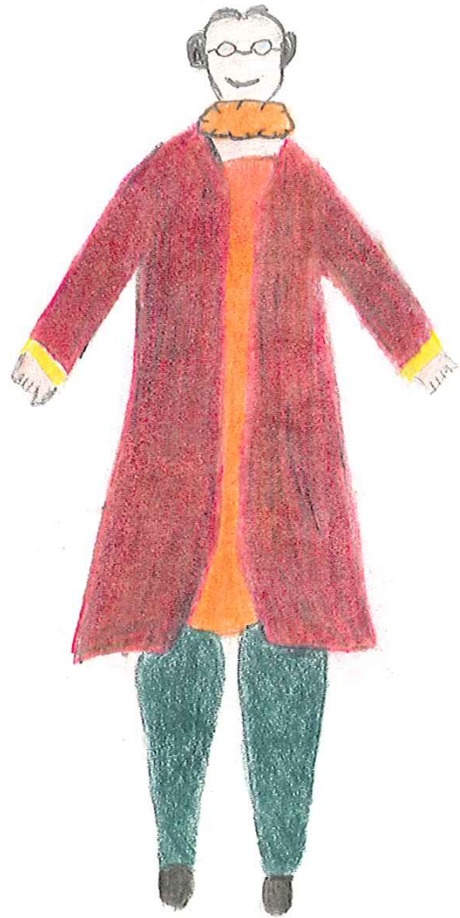
déonide Sylviane Tille