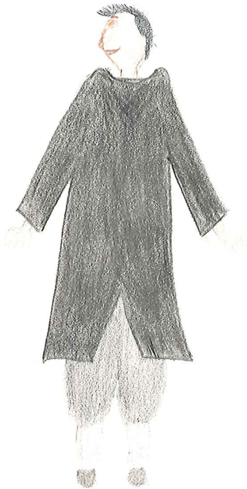
Agis Christophe Sermet