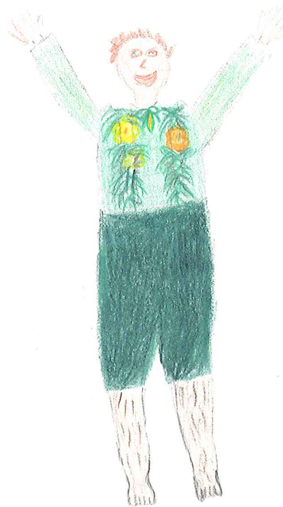
Dimas Marc Beaupré