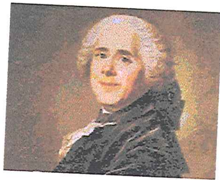
Pierre Carlet de Chamblain de Marivaux (1688-1763), dramaturge français dont l'œuvre dramatique renouvela le genre de la comédie au XVIII e siècle.